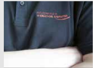
Service & Support

Servicios y sistemas de alineación láser para una óptima alineación de máquinas y sistemas.