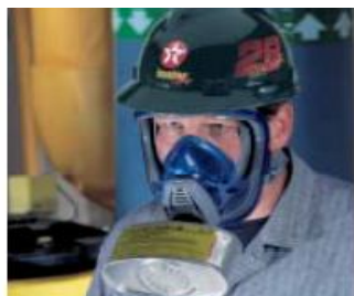
Configuración de un puerto con canister para máscara de gas estilo barbilla.