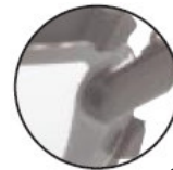
Suave espuma para contacto con el rostro