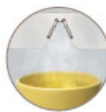
Exclusivo recubrimiento DX