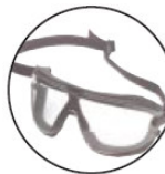
Banda elástica para ajuste (opcional)