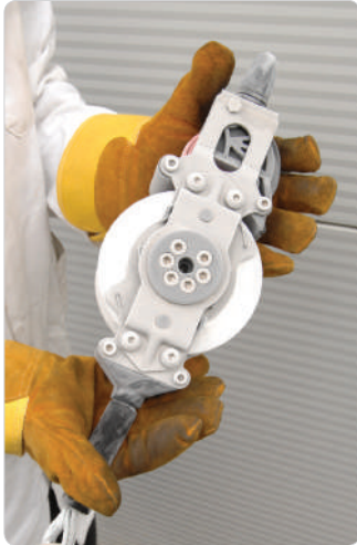
Funciona en condiciones bajo cero