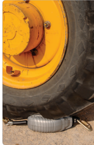
Carcasa resistente a impactos

Probado a una temperatura de operación de -22°F to +129°F (-30°C to +54°C).