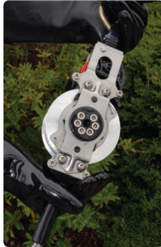
Puede soportar contaminantes