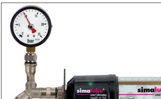
El simalube IMPULSE puede desarrollar hasta 10 bares