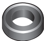
Cinta de teflón