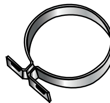
Abrazadera para montaje con tornillos 1/4" x 1 1/4"