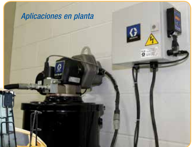
Aplicaciones en planta